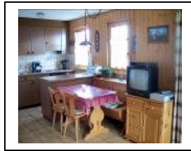
Küche & Essbereich